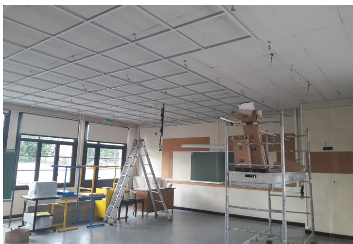
Pose de faux plafond : école élémentaire des Caussades (ainsi que l'école des Gavastous et le groupe scolaire du Pilat)